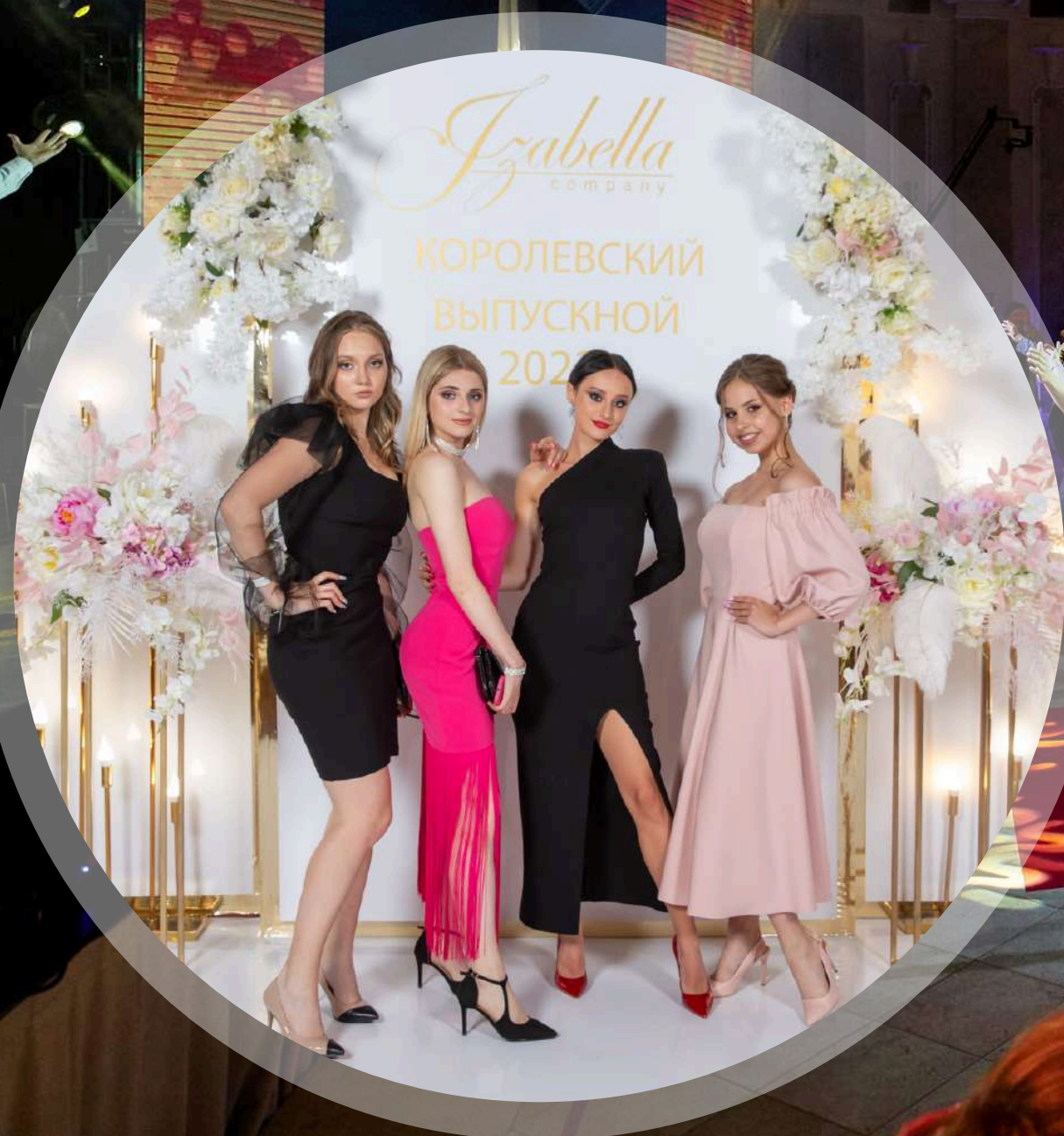
Фото и Видеосъёмка на все мероприятия